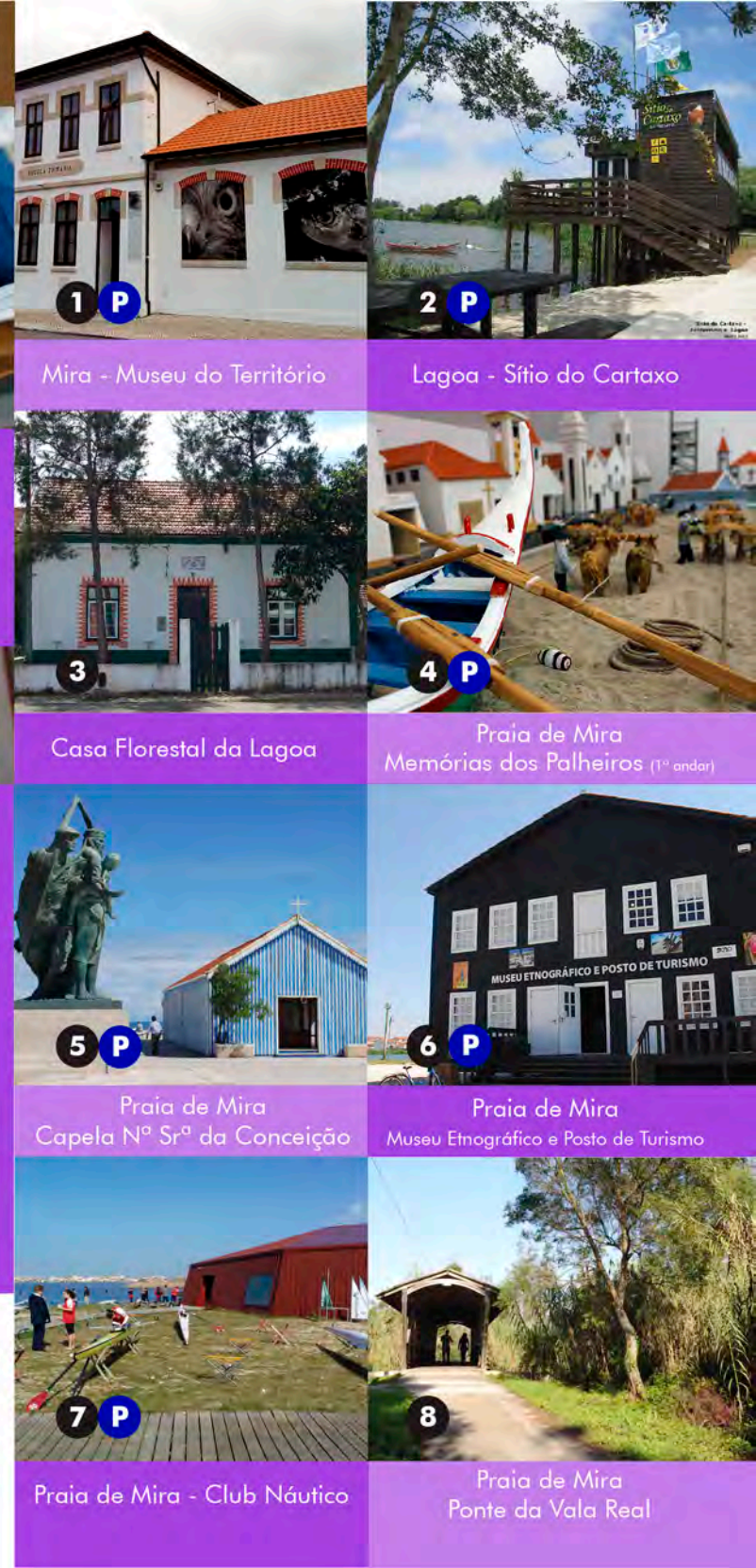
1 P Mira - Museu do Território